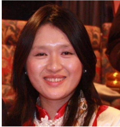
Bolu Wang China

«Promotional finance for energy efficiency in buildings»