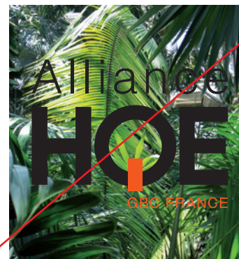
Utiliser sur fond complexe

Le logo doit être utilisé dans le respect des éléments qui le composent, voici quelques exemples de ce qu'il ne faut pas faire.