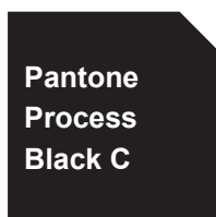
Pantone Process Black C