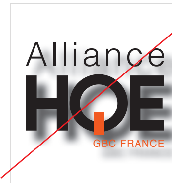
Créer des effets