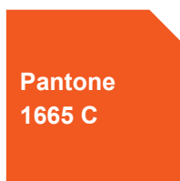
Pantone 1665 C

Les 2 couleurs qui composent le logotype sont à respecter scrupuleusement dans toute reproduction. Voici les spécificités d'interprétation selon les modes d'utilisation : quadrichromie, RVB et tons directs.