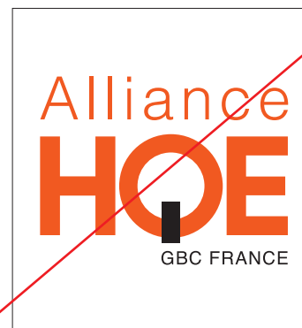
Inverser les couleurs