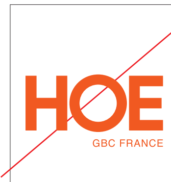
Supprimer un ou plusieurs éléments