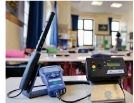
Exemple de l'évolution de la concentration de formaldéhyde en milieu professionnel